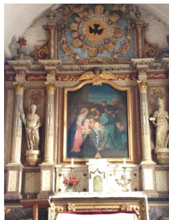
Le retable en marbre doit faire l'objet d'une restauration

La décoration intérieure est du XVIIIème siècle, notamment grâce aux attentions de Claude-Adrien Helvétius, fermier général et châtelain de Voré et Feillet, mais aussi poète et philosophe du siècle des Lumières.